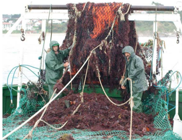
Au Pays basque, les algues rouges se ramassent à la fin de l'été sur les récifs rocheux.

Une trentaine d'experts ont été écoutés, afin de définir comment le biomimétisme peut influencer les stratégies d'entreprise, la recherche et le développement. Le but est de déterminer de nouveaux modèles économiques. « Si un quart des entreprises [NDLR: des quatre secteurs précités] adoptait une approche biomimétique, on augmenterait le PIB de 375 millions d'euros et on créerait 5 626 emplois », rapporte Amé-