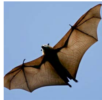
L'avion s'inspire de la chauve-souris, entre autres. MARK BAKER