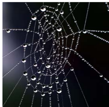
Au regard de leur poids, les soies de l'araignée sont plus solides que l'acier.

Des chars de soie. Centre de recherche Paul Pascal, campus de Bordeaux. Ici, on ne travaille pas sur le biomimétisme, mais sur les nouveaux matériaux composites. On parle, de fait, plutôt d'analogie que de biomimétisme. L'objectif est d'utiliser des particules de petite dimension présentant une très grande dureté. Résoudre la problématique des matériaux rigides mais cassants, légers mais qui se déforment, bref, mettre au point des nanomatériaux capables d'encaisser des chocs violents sans rupture. L'idée est donc de générer une résistance avec absorption de l'éner-