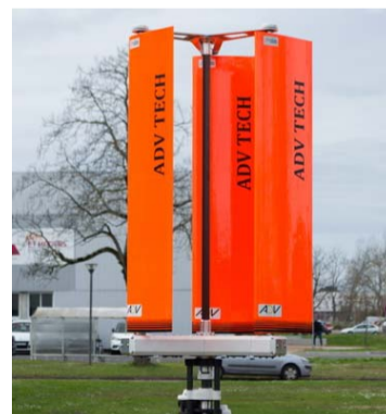
Les pales reproduisent la nage du poisson.

Dans les années 1970, les Américains ont eu l'idée de s'inspirer du mouvement de la nage des poissons pour réaliser un nouveau genre de propulseur. Quarante ans plus tard, un Français parvient à réaliser pour la première fois ce genre de rotor biomimétique de manière efficace.