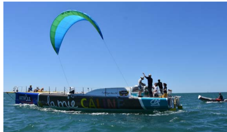
La voile du kite développée par la société de Yves Parlier reproduit les mouvements de la mouche.

gie, sans rupture. Comme la toile d'araignée ou la carapace de certains mollusques. Dans le cas de l'araignée, c'est la structure moléculaire du fil qui oppose son élasticité au choc et lui confère des propriétés mécaniques exceptionnelles. Par rapport à leur poids, les soies de l'araignée sont bien plus solides que l'acier ou le Kevlar, avec une densité moindre. Les applications potentielles ? Pales d'éolienne, pare-chocs de voiture, gilets pare-balles, blindage de chars, raquettes de tennis, planches de snowboard.